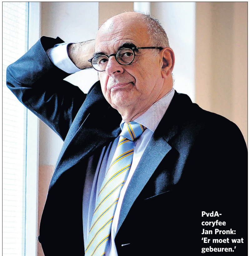
PvdA-coryfee Jan Pronk: 'Er moet wat gebeuren.'

„Nu willen kiezers een bevlogen politicus die zegt: hier sta ik voor. Geen politicus die vraagt: hoe zou u het gehad willen hebben? Alle partijen in het midden lijken daarvoor op elkaar. Dat straft de kiezer af. Bos is iemand die zo'n inspirerend verhaal kan brengen. Maar hij zit vast in het kabinet.”