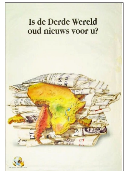
Is de Derde Wereld oud nieuws voor u? ca. 1986