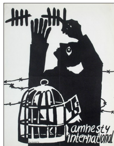
Amnesty International 1969 - Joop Lieverst