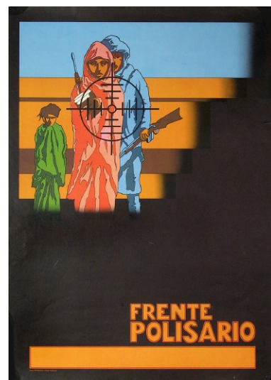
Frente Polisario 1977 - Hans Hoogenbos