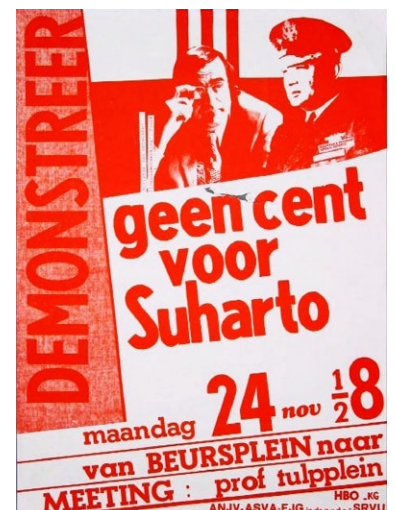
Geen cent voor Suharto 1975 - Rob Schotman