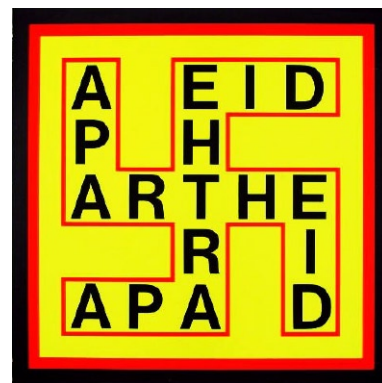
Apartheid 1979 - Jan Wolkers