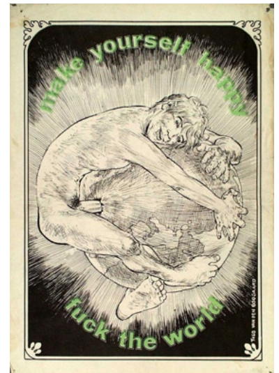
Make yourself happy fuck the world ca. 1971 - Theo v.d. Bogaard

Overigens nam hij twee persoonlijke uitersten op: een affiche dat hij zelf liet maken en een met hemzelf als mikpunt. 'Is de derde wereld oud nieuws voor u?' (bij een verfrommelde krant met het Afrikaanse continent erin) is uit een reeks van vier die Pronks ministerie ooit liet maken maar zelf figureert de jonge langharige minister op het in rood gedrukte actieplakkaat met 'Geen cent voor Suharto'. "Ach ja, dat hoorde er bij",