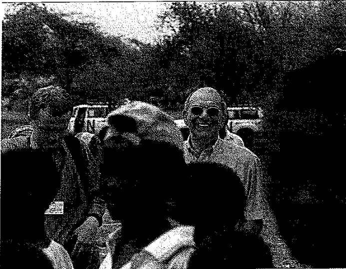
PETTERIK WIGGERS / HH