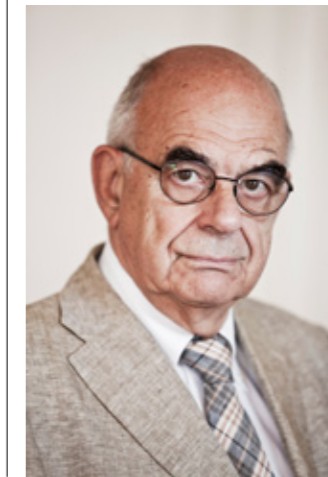
Jan Pronk was minister voor Ontwikkelingssamenwerking en speciaal VN-gezant in Soedan. Momenteel is hij hoogleraar aan het Institute for Social Studies in Den Haag

Zij beseffen dat ze de wereld niet kunnen redden, maar dat zij – als ze zich blijven inzetten – de catastrofe kunnen uitstellen, iedere dag opnieuw wat verder uitstellen. Dat heeft zin. ●