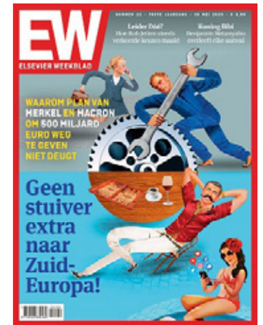
Cover Elsevier Weekblad: hardwerkende Noordelingen versus luierende Zuidelingen

Rachel Carson begint haar boek Silent Spring (1962) met een fabel over een dorp